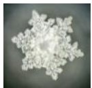
Wasserkristall Dr. M. Emoto Zertifiziert